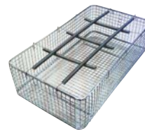
滅菌バッグ専用網かご 寸法:170(W)×310(D)×100(H)mm