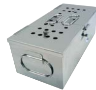
専用ステンレス角カスト 寸法:160(W)×310(D)×127(H)mm